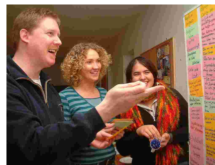
Viele gute Ideen wurden gesammelt.