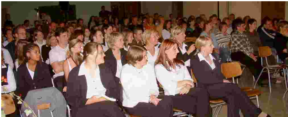
Der letzte SNS-Gottesdienst am 7. Oktober 2006 in Gerchsheim fand großen Zuspruch.

Schon vor längerer Zeit war bei einigen Gemeindegliedern der Wunsch nach einem Gottesdienst in moderner Form vorhanden. Hiermit war die Hoffnung verbunden, auch kirchenferne Menschen zu erreichen. Nach vielen Gesprächen, in denen über die Vor- und Nachteile eines solchen Gottesdienstes diskutiert wurde, haben wir diesen Schritt vor fünf Jahren gewagt.