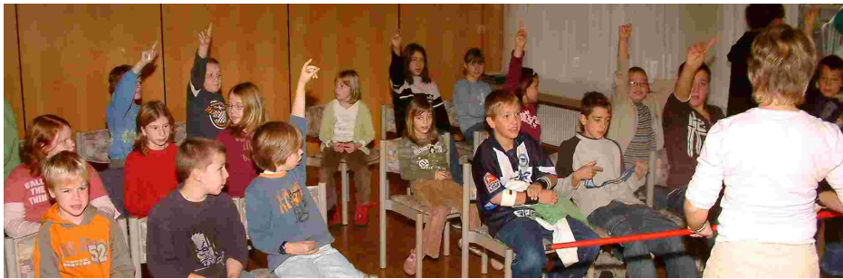
Kindergottesdienst-Samstag-Spezial am 11. November 2006

Ein besonderes Anliegen war es, wie wir engagierte Mitarbeiter bekommen, die ein Herz für Kinder haben. Hierbei ist unser Ziel, dass jeder Mitarbeiter ca. alle 2-3 Wochen Dienst hat. Können wir dies erreichen? Nur mit Ihrer Hilfe. Wenn Sie denken – vielleicht ist dies mein Platz der Mitarbeit in der Gemeinde, dann sprechen Sie uns an oder schauen Sie doch einfach mal rein. Sie sind uns herzlich willkommen.