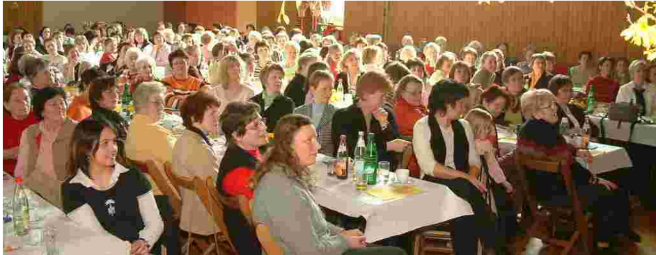
Frauentag am 12. März 2006 zu den Themen: „Unsere Temperamente“ und „Die Fünf Sprachen der Liebe“.

Das Jahr 2006 geht langsam dem Ende entgegen. Ein voll gepacktes Jahr mit vielen wunderbaren Erfahrungen liegt als Gemeinde hinter uns. Einige wenige Eindrücke sollen hier im Bild festgehalten werden.