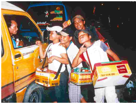
An Ampeln verkaufen die Straßenkinder Zigaretten und Getränke

In der Drei-Millionen-Einwohner-Metropole Medan schlagen sich Hunderte von Kindern und Jugendlichen ohne Zuhause durch. Im „Haus der Kinderkreativität“ finden die Straßenkinder, um die sich sonst niemand kümmert, die Zuflucht, die sie so dringend benötigen.