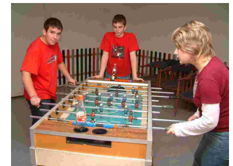
Gemeinsam Spaß haben.

2. Zukunftswerkstatt Gemeindejugend: Am Samstagnachmittag arbeiteten alle Jugendlichen ganz intensiv an der Frage, was in unserer Gemeindejugend „dran“ ist. Welche Erwartungen haben die Jugendlichen und was will Gott von uns. Zu wichtigen Themen wurden konkrete Ziele und Schritte überlegt.