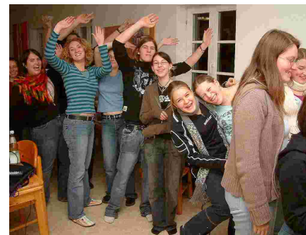
Die Jugendfreizeit kam gut an!

Mit 25 Personen ging es auf ein Wochenende für Jugendliche und junge Erwachsene. Dieses hatte drei Schwerpunkte: