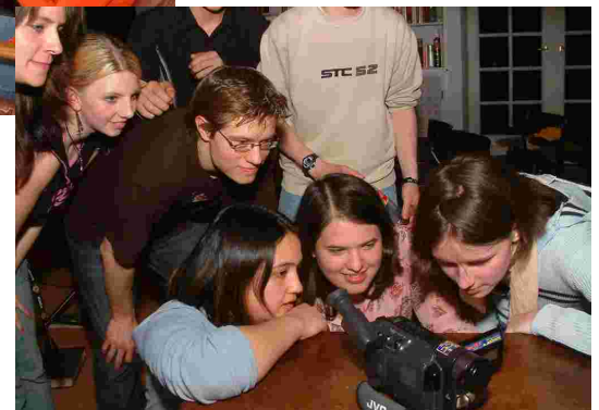
... und sorgt für viel Spaß. ■