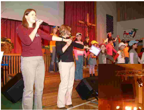
ProChrist für Kids mit Spielzeit, Lieder mit viel Bewegung (siehe Bild links) und der Liveschaltung nach München.

Bei ProChrist 2006 wurde die Turnhalle an jedem Abend voller.