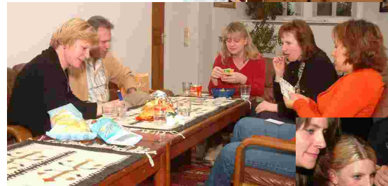
Triefenstein tut einfach gut ...