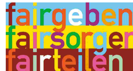
Das Motto von »Brot für die Welt«