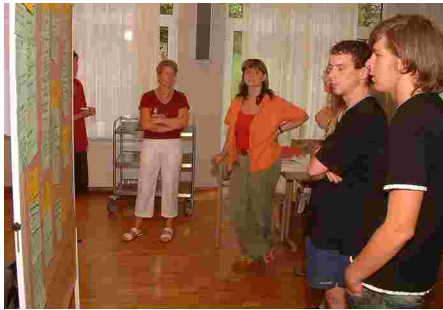
Standortbestimmung am 8. Juli 2006

Die jüngeren Kinder treffen sich im »Regenbogenland« im Ev. Kindergarten und die Älteren in der »Tankstelle« im Gemeindehaus. Mitarbeiter erwarten sie, um mit ihnen zu spielen und zu basteln, eine biblische Geschichte wird dargestellt und wir überlegen, was das mit unserem Alltag zu tun hat.