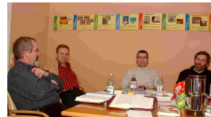
Kirchengemeinderat in Klausur

N achdem wir uns als Kirchengemeinderat in einem ersten Schritt im Januar 2004 über die biblischen Grundwerte unserer Gemeinde Gedanken gemacht haben, beschäftigten wir uns im Jahr 2006 auf einem Klausurwochenende mit der Frage: Welche Ziele sollen wir nach Gottes Willen als Gemeinde verfolgen?