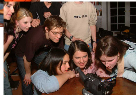
... und sorgt für viel Spaß. ■