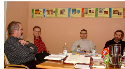
Kirchengemeinderat in Klausur

Nachdem wir uns als Kirchengemeinderat in einem ersten Schritt im Januar 2004 über die biblischen Grundwerte unserer Gemeinde Gedanken gemacht haben, beschäftigten wir uns im Jahr 2006 auf einem Klausurwochenende mit der Frage: Welche Ziele sollen wir nach Gottes Willen als Gemeinde verfolgen?