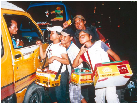
An Ampeln verkaufen die Straßenkinder Zigaretten und Getränke

In der Drei-Millionen-Einwohner-Metropole Medan schlagen sich Hunderte von Kindern und Jugendlichen ohne Zuhause durch. Im „Haus der Kinderkreativität“ finden die Straßenkinder, um die sich sonst niemand kümmert, die Zuflucht, die sie so dringend benötigen.