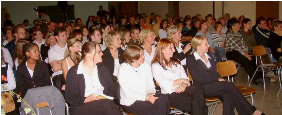
Der letzte SNS-Gottesdienst am 7. Oktober 2006 in Gerchsheim fand großen Zuspruch.

Schon vor längerer Zeit war bei einigen Gemeindegliedern der Wunsch nach einem Gottesdienst in moderner Form vorhanden. Hiermit war die Hoffnung verbunden, auch kirchenferne Menschen zu erreichen. Nach vielen Gesprächen, in denen über die Vor- und Nachteile eines solchen Gottesdienstes diskutiert wurde, haben wir diesen Schritt vor fünf Jahren gewagt.