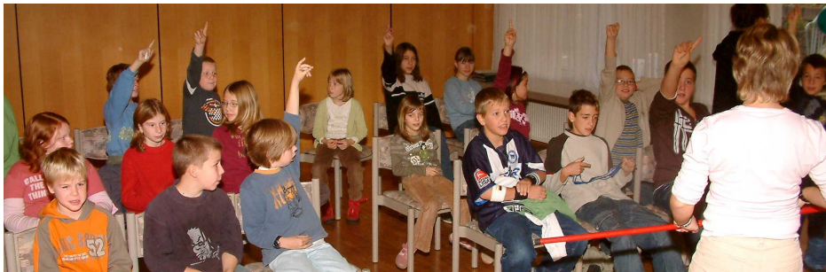
Kindergottesdienst-Samstag-Spezial am 11. November 2006

Ein besonderes Anliegen war es, wie wir engagierte Mitarbeiter bekommen, die ein Herz für Kinder haben. Hierbei ist unser Ziel, dass jeder Mitarbeiter ca. alle 2-3 Wochen Dienst hat. Können wir dies erreichen? Nur mit Ihrer Hilfe. Wenn Sie denken – vielleicht ist dies mein Platz der Mitarbeit in der Gemeinde, dann sprechen Sie uns an oder schauen Sie doch einfach mal rein. Sie sind uns herzlich willkommen.