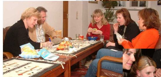
Triefenstein tut einfach gut ...