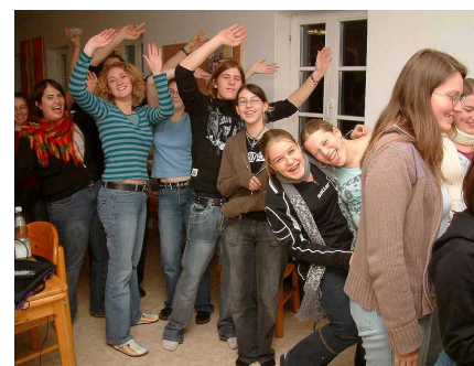
Die Jugendfreizeit kam gut an!

Mit 25 Personen ging es auf ein Wochenende für Jugendliche und junge Erwachsene. Dieses hatte drei Schwerpunkte: