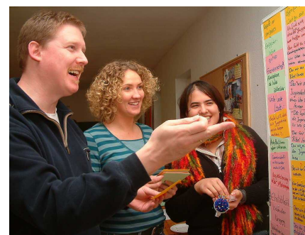
Viele gute Ideen wurden gesammelt.