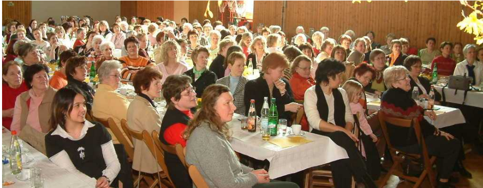
Frauentag am 12. März 2006 zu den Themen: „Unsere Temperamente“ und „Die Fünf Sprachen der Liebe“.

Das Jahr 2006 geht langsam dem Ende entgegen. Ein voll gepacktes Jahr mit vielen wunderbaren Erfahrungen liegt als Gemeinde hinter uns. Einige wenige Eindrücke sollen hier im Bild festgehalten werden.