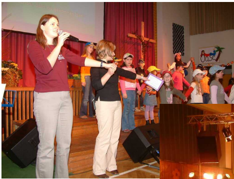
ProChrist für Kids mit Spielzeit, Lieder mit viel Bewegung (siehe Bild links) und der Liveschaltung nach München.

Bei ProChrist 2006 wurde die Turnhalle an jedem Abend voller.