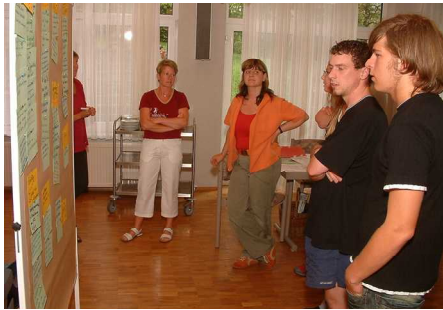
Standortbestimmung am 8. Juli 2006

Die jüngeren Kinder treffen sich im »Regenbogenland« im Ev. Kindergarten und die Älteren in der »Tankstelle« im Gemeindehaus. Mitarbeiter erwarten sie, um mit ihnen zu spielen und zu basteln, eine biblische Geschichte wird dargestellt und wir überlegen, was das mit unserem Alltag zu tun hat.