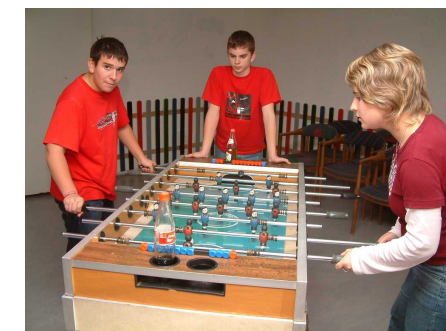
Gemeinsam Spaß haben.

2. Zukunftswerkstatt Gemeindejugend: Am Samstagnachmittag arbeiteten alle Jugendlichen ganz intensiv an der Frage, was in unserer Gemeindejugend „dran“ ist. Welche Erwartungen haben die Jugendlichen und was will Gott von uns. Zu wichtigen Themen wurden konkrete Ziele und Schritte überlegt.