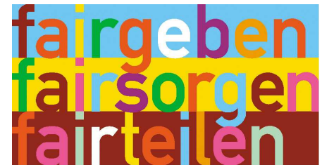
Das Motto von »Brot für die Welt«