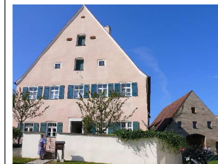
Freizeit in Fiegenstall 2009 ■

Auch nächstes Jahr wird das wieder so sein. Merkt euch den Termin gleich vor: Vom 10. - 13. September 2009 gibt es wieder eine Jugendfreizeit mit viel Freizeitwert und geistlichem Tiefgang. Diesmal fahren wir in die Nähe von Brombachsee und Altmühltal, nämlich nach „Fiegenstall“ (ja, tatsächlich ohne „L“ an zweiter Stelle) bei Pleinfeld. Wenn du Teenager, Jugendlicher oder junger Erwachsener bist, dann komm doch mit! Es wird bestimmt „echt cool“.