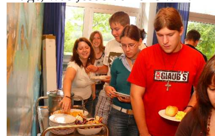
Leckeress (auch) beim Brunch

Natürlich gab es auch ein gutes geistliches Programm. In gemeinsamer Stiller Zeit am Morgen, in Andacht, Bibelarbeit und dem abschließenden Brunchgottesdienst ging es um die Bergpredigt. „Hammerhart, was Jesus da sagt!“ - Da geht es ganz zentral um die Frage, was Jesus von uns will.