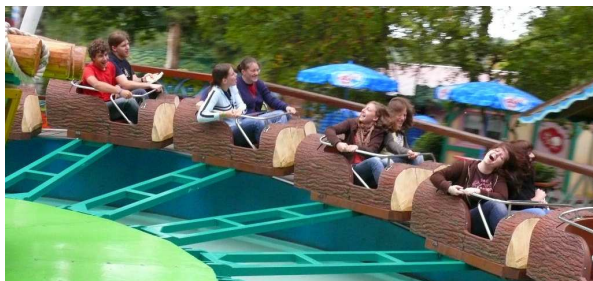
Fahrtwind in Geiselwind

Freitags waren wir einen ganzen Tag im Freizeitpark Geiselwind. Der Eintrittspreis hierfür war im günstigen Freizeitpreis von 60 Euro bereits enthalten. In kleinen Gruppen wurde der Park erkundet und die Fahrgeschäfte genutzt bis es einem schlecht wird ... Das machte super viel Spaß. - Spielerisch war am Donnerstagabend und Samstagnachmittag einiges geboten.