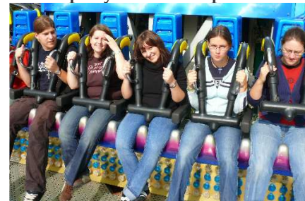
Nicht nur geistlich, auch im „Free-fall-Tower“ wollen sie „nach oben“

Natürlich gab es auch ein gutes geistliches Programm. In gemeinsamer Stiller Zeit am Morgen, in Andacht, Bibelarbeit und dem abschließenden Brunchgottesdienst ging es um die Bergpredigt. „Hammerhart, was Jesus da sagt!“ - Da geht es ganz zentral um die Frage, was Jesus von uns will.