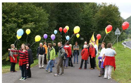
Luftballons als sichtbares Zeichen

Im Sommer hatten fünf kirchliche Mitarbeiter aus Ghana den Kirchenbezirk Wertheim besucht. Auch in unserer Gemeinde war die Gruppe mehrmals zu Gast. Zwei von ihnen hatten sogar 10 Tage in unserer Gemeinde gewohnt.