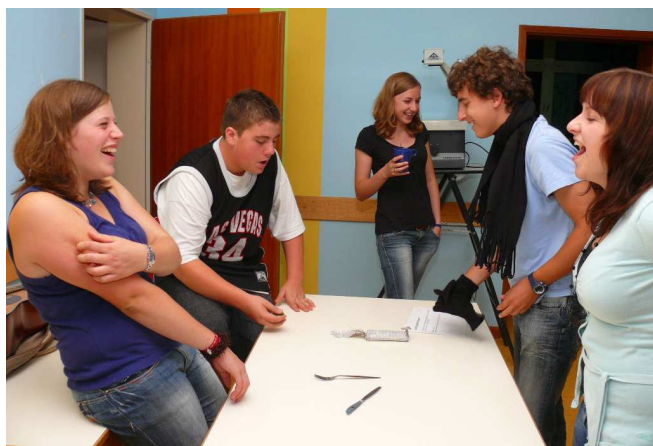
Action beim Spiel- und Spaß-Abend

Das war nun Jugendfreizeit Nummer 3 in Folge. Und dieses Mal gab es in Markt Bibart so viel „Freizeit“ wie bei keiner der beiden zuvor. Und das gilt sowohl vom zeitlichen Umfang, wie auch inhaltlich: Die bisherigen Freizeiten waren nur freitags bis sonntags. Dieses Mal haben wir bereits einen Tag früher, nämlich am Donnerstag, den 4. September 2008 begonnen. Bei der ersten Freizeit im Jahr 2006 (Klotzenhof) stand inhaltlich die Standortbestimmung der Jugendarbeit im Vordergrund. 2007 (Markt Bibart) haben wir dann unter dem Motto „Entdecke was in dir steckt“ an dem