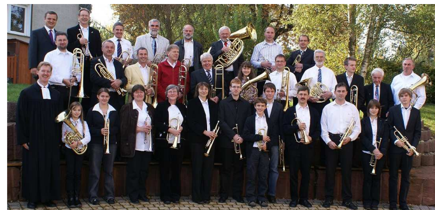
Wenkheimer Posaunenchor mit Unterstützung aus dem Kirchenbezirk

Mit dem Schlusslied „Herr, bleib bei mir“ und dem Segen endete der Festakt in der Kirche. Es schloss sich ein gemütliches Beisammensein im Gemeindehaus neben der Kirche an. Dort war auch eine kleine Ausstellung aufgebaut, die Bilder aus älteren und jüngeren Zeiten über die Arbeit des Posaunenchores zeigte.